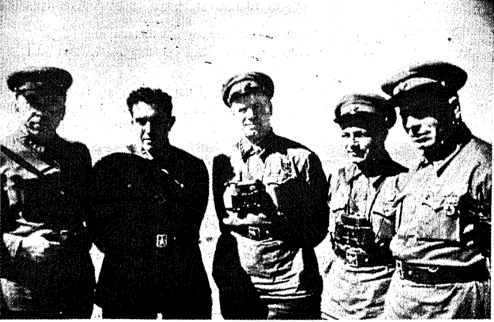
المارشال جوكوف بطل معركة ستالينغراد في صورة له مع كبار الضباط أثناء الحرب. وقد كرمته القيادة الروسية مؤخراً في الذكرى الخمسين للحرب العالمية الثانية.

كان ستالين كل ساعتين أو ثلاثاً يطالب بتقرير من ستالينغراد، ويتحدث مراراً بالهاتف مع جوكوف وفاسيليفسكي الذي أرسله إلى هناك من جديد. أما المحادثات مع مالينكوف، فلم تكن تجلب له الرضى. كان ستالين قد أرسل هذا الرجل الذي لا حول ولا قوة في الشؤون الحربية، فقط بمثابة رقيب يذكر العسكريين بمطالب «الأعلى» ويجمع المعلومات حول عمل هيئات الأركان. لم يحصل لـ مالينكوف أن ذهب إلى الجبهة سوى مرة أو مرتين، أما باقي الوقت، فكان يتواجد إما في هيئة أركان أو في مكتب خاص، يستدعي إليه الموجهين السياسيين وقادة «الأقسام الخاصة». كان القادة العسكريون يتعاملون مع مالينكوف بلباقة، وبما أنهم يفهمون الدور الموكل إليه، لا يدخلون معه في أحاديث إلا بمبادرة منه.